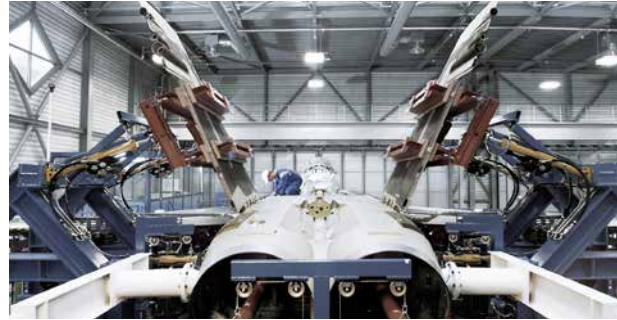
F/A-18 Struktursanierungsprogramme Einbau von leistungs- und belastungsstärkeren Strukturbauteilen inkl. Verlängerung der Lebensdauer (von 5000 auf 6000 Flugstunden)