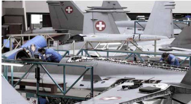
F/A-18 Upgradeprogramme Modernisierung verschiedener Instrumente damit Systeme auf dem neuesten Stand sind