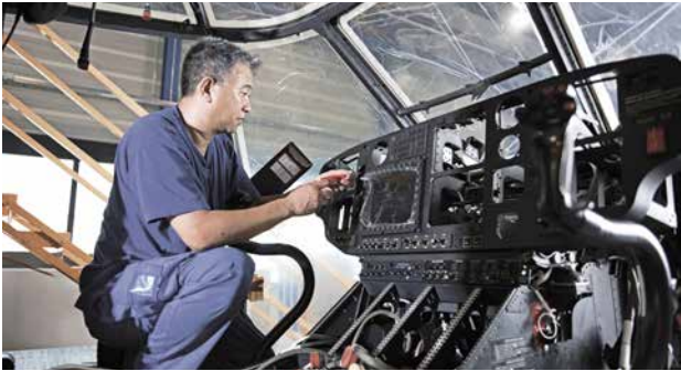
Super Puma/Cougar Upgrade (WE89 & WE98) Durch Modernisierung verschiedener Systeme werden die Cougar TH98 praktisch zu neuwertigen Helikoptern.