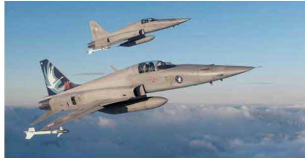
Weiterbetrieb des F-5E/F nach geplanter Ausserdienststellung Die grosse Anzahl notwendiger Kontrollen erforderte die kurzfristige Nutzung von zusätzlichen Kapazitäten aus dem Global Business.