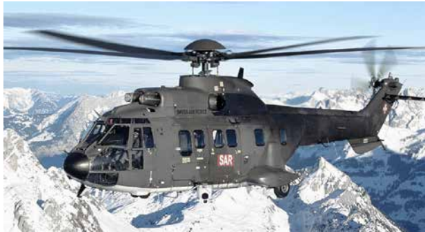
Ersatz FLIR-Wärmebildkameras bei Super Puma Quantensprung bei der Leistungsfähigkeit durch stark verbesserte Infrarotkameras