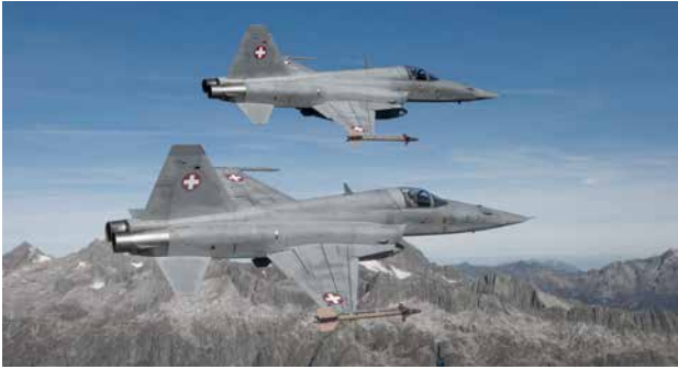
Austausch «Upper Cockpit Longeron» (UCL) an F-5 Auswechslung von stark beanspruchten Strukturbauteilen ermöglichte Weiterbetrieb der Flotte