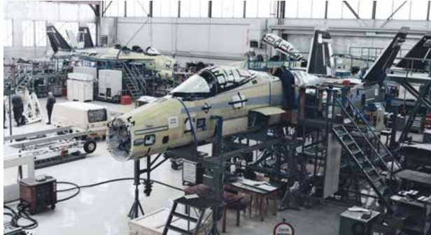
Endmontage F/A-18, F-5, Super Puma, EC-635 Aufbau der Kompetenzen für Unterhalt und Upgrades bereits vor der Flugzeugauslieferung