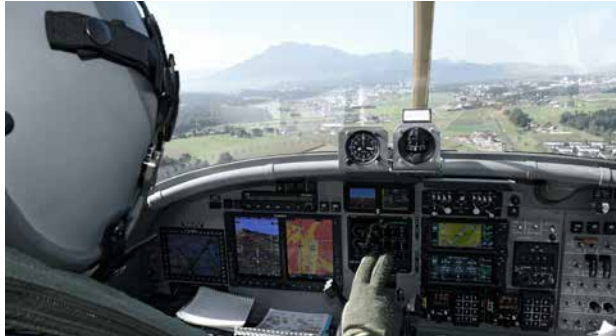
PC-6 Upgrade (NCPC-6) Ersatz der analogen Geräte durch elektronische Instrumentensysteme und zentrale Bildschirme